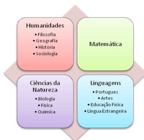
Figura 1: Unidades curriculares por área de conhecimento

Nesse sentido, a integração organizada pelas grandes áreas do conhecimento, reafirma e aprofunda os fundamentos das Diretrizes Curriculares (DCNEM), em que os objetivos de aprendizagem são definidos por áreas e não necessariamente divididos entre as unidades curriculares que as compõem. O trabalho realizado nas áreas não exclui a divisão das unidades curriculares, incluindo, assim, todos os conteúdos curriculares previstos na legislação. A Figura 1 apresenta as unidades curriculares de cada uma das áreas de conhecimento deste núcleo.